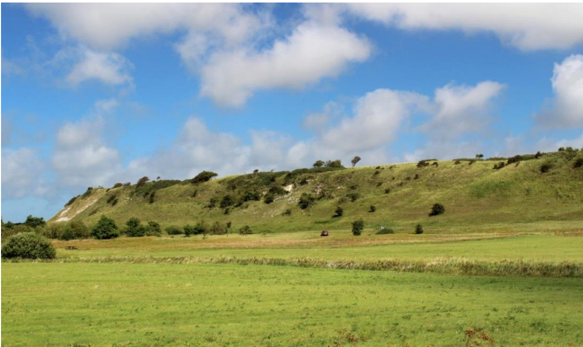
Figur 2: Korsø Knude består af stejle nordvestvendte overdrevsskrænter og det omkringliggende klitlandskab.

Den eneste art på områdets udpegningsgrundlag er odder (se bilag 2). Der er ingen specifik indsats for arten, udover indsatsen for naturtyper på de offentlige arealer, hvor ejeren gennemfører Natura 2000-planen i egne drifts- og plejeplaner (bilag 1). Indsatsen for naturtyperne forventes i væsentligt omfang at bidrage til at sikre egnede levesteder for arten.