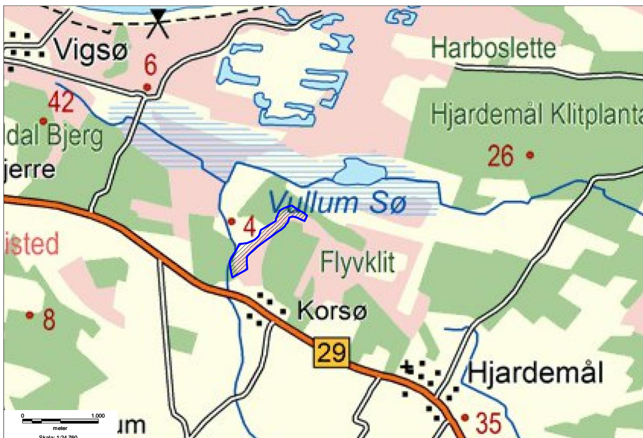
Figur 1: Den blå skravering på kortet viser udstrækningen af Natura 2000-område nr. 45 Korsø Knude.

Langt størstedelen af dette område (omkring 95 %), derunder alt kortlagt habitatnatur i området, er statsejet.