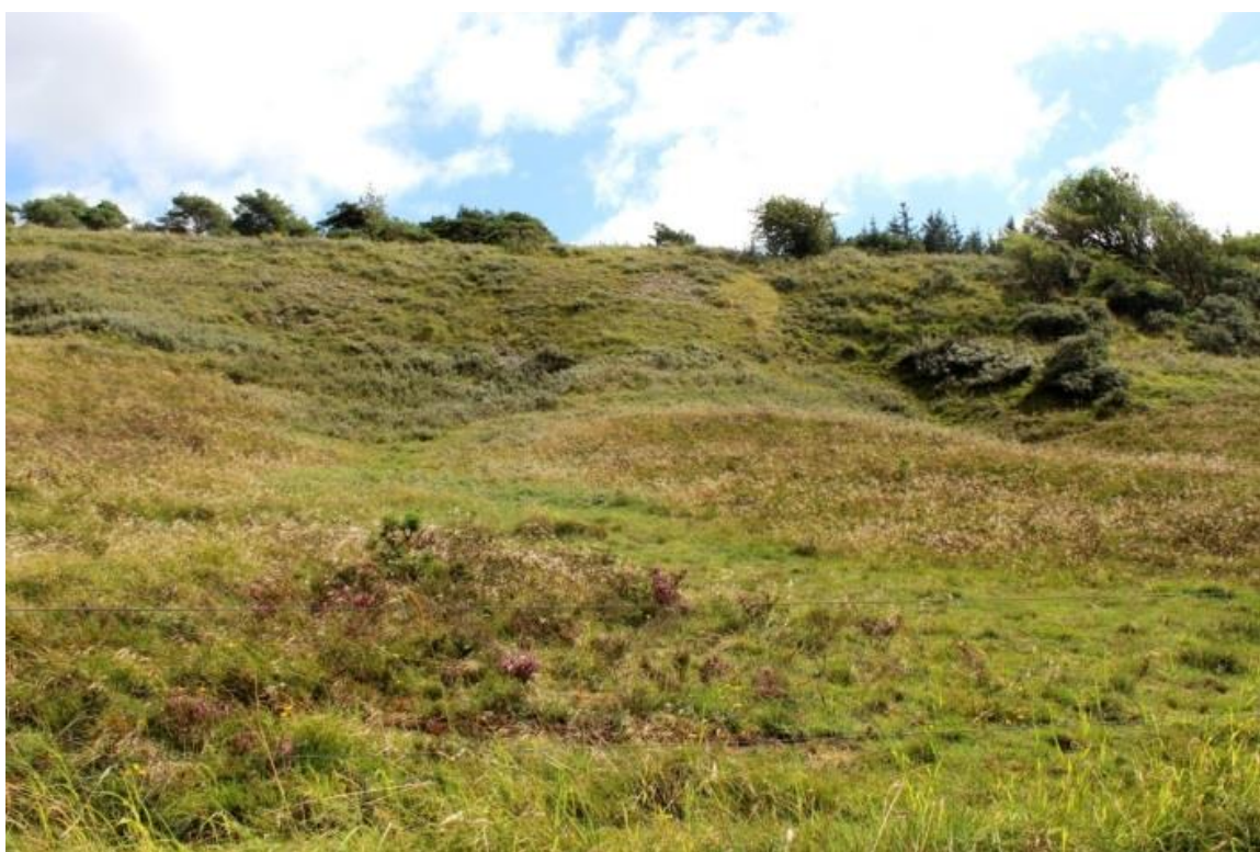
Figur 3: Korsø Knude. I forgrunden ses hedevegetation. I baggrunden ses kalkoverdrev.

Eventuelle projekter gennemføres ved frivillige aftaler, og derfor er det i mange tilfælde ikke på nuværende tidspunkt muligt at beskrive hvornår projekterne fysik bliver udført. Kommunen vil i hvert enkelt tilfælde sørge for, at relevante interessenter bliver inddraget.